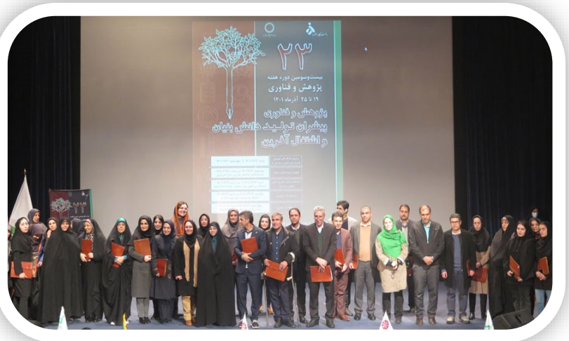
بیست و سومین دوره هفته پژوهش و فناوری با تجلیل از پژوهشگران برتر دانشگاه الزهراء به کار خود پایان داد