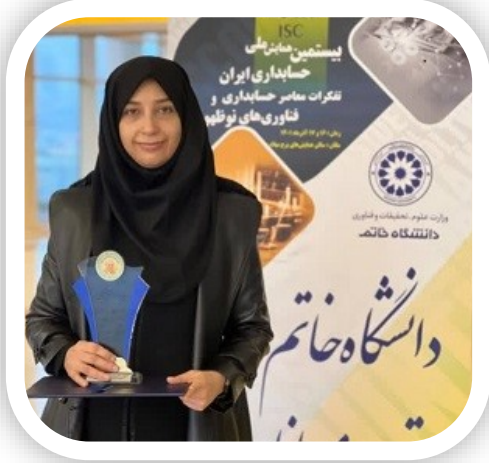
دریافت جایزه بهترین عضو هیات علمی جوان حسابداری ایران